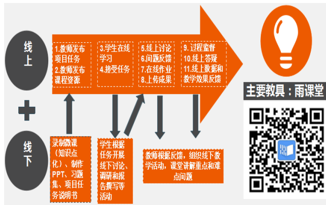
图3 雨课堂在课堂教学中的实施图

利用雨课堂这一教学工具,覆盖了课上一课中一课下每一个教学环节,释放了教与学的能量,真正实现的“线上与线下”、“课中与课外”的无缝连接,推动了《旅游学概论》这门课程的教学改革。