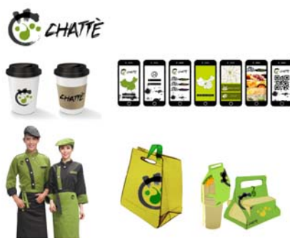
图2 学生部分设计作品

值得注意的是高级课程《产品设计1》,课程采用团队项目教学,要求学生综合运用理论技艺进行团队合作,体验从设计理念到市场运用,完成一系列完