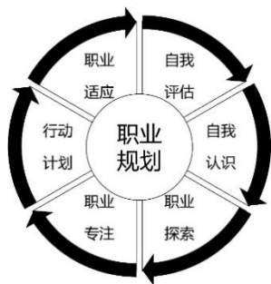
图1 定向师范生职业规划的六个阶段

由于缺乏职业规划课程,定向师范生的特殊就业渠道以及所处年龄阶段特点等实际情况,其职业规划与一般意义的职业规划和针对高校大学生的职业规划都有所不同,笔者结合职业规划的“5W”理论(杨红秀,2014),并参考了澳大利亚维多利亚州针对中学生的职业规划课程,笔者将定向师范生的职业规划课程划分为六个阶段,如图1所示,在不同学期各有侧重。