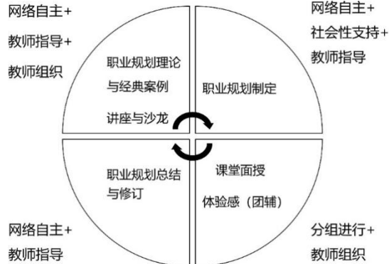
图3 职业规划课程学习过程