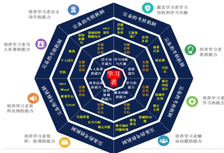
图2 基于ARCS模型的德育教育主题班会开展模式图

ARCS模型是由美国佛罗里达大学教授约翰·凯勒于1987年提出的用于激发和维持学生学习动机的模型。该模型由注意