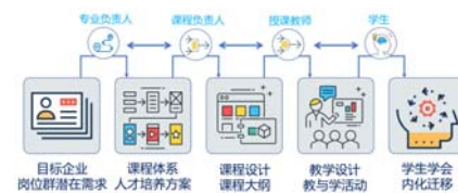
图3 教学过程中的四次解构重构