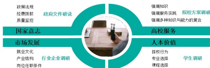
图2 人才培养方案修订调研方向

当前很多高校学生普遍反映学校实践教学较少,甚至没有物流实训场地。其主要原因是物流专业实训室建设一般成本较高,所以很多高校不愿意投入。私立学校尤为明显。当前很多私立院校都是自负盈亏,教育厅总体拨款较少,实训室建设只能依靠自主建设。而有的学校可能物流只有1-2个班级,也不愿意建设物流实训基地。实训场地比较好的是公立院校,因为他们一般都是国家投资,所以实训室建设较好,但是实际教学中发现,很多公立院校虽然花高价建立了物流实训室,但是应用却并不多,甚至建完物流实训室后,很少让学生进行实训。